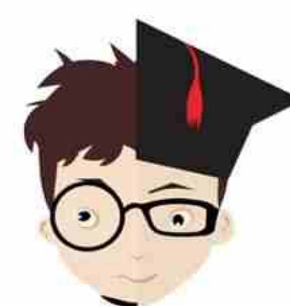
चित्र - 2 / Figure - 2

Note: Figure not to scale. Use the given dimensions for solutions