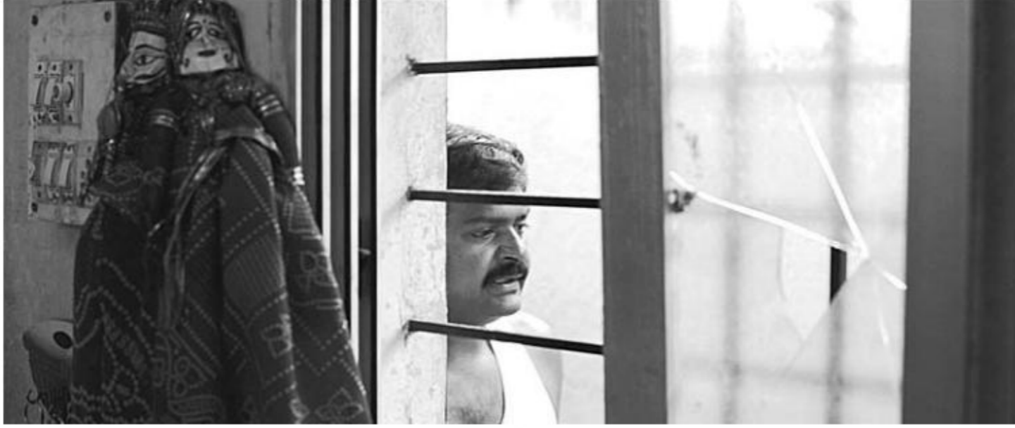
Visual / दृश्य 1