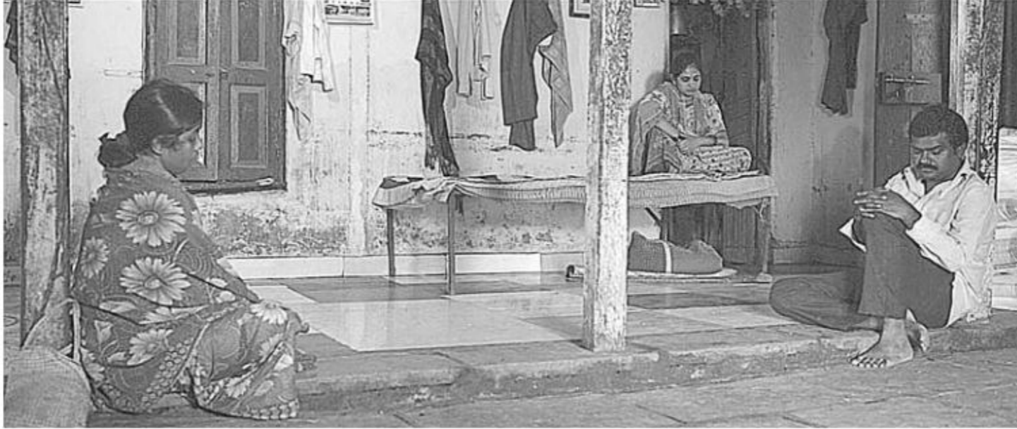
Visual / दृश्य 2